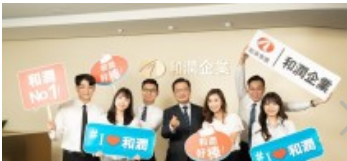
和潤企業打造幸福職場