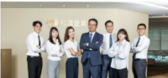
和潤企業打造幸福職場