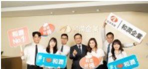
和潤企業打造幸福職場

哺乳室 週休二日 家庭照顧假 勞保 健保 陪產假 產假 特別休假 育嬰留停 女性生理假 勞退提撥金 安胎假 產檢假 就業保險 防疫照顧假 員工體檢 職災保險