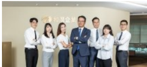
和潤企業打造幸福職場